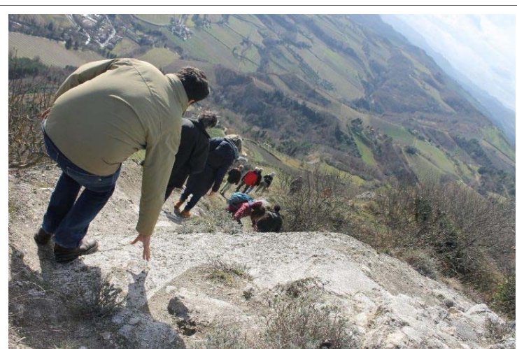
Escursione al Parco della Vena del gesso

Cercasi bimbi e ragazzi che amano la natura e che vogliono collaborare alla valorizzazione del Parco della Vena del gesso romagnola... Per loro c'è una nuova opportunità che vi raccontiamo qui sotto.