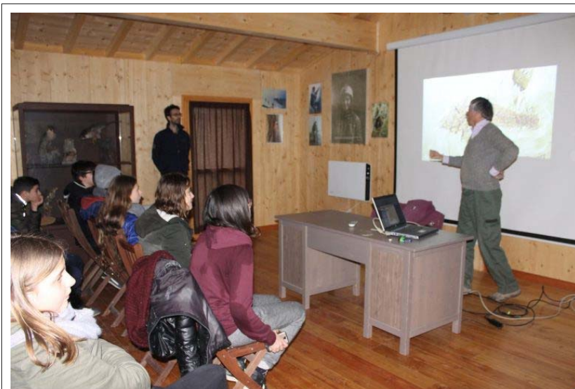
Incontro al centro visite

Le iscrizioni, già aperte, si possono effettuare direttamente online, sul sito internet dell'Ente di Gestione per i Parchi e la Biodiversità Romagna ( www.parchiromagna.it ), via email (promozione@parchiromagna.it) oppure telefonicamente (0546-77404). Esiste un Albo, a cui tutti possono iscriversi, e una sezione speciale, quella dei Giovani Amici, riservata ai minori di 18 anni . La domanda di adesione all'Albo deve essere compilata e sottoscritta da un genitore (o tutore).