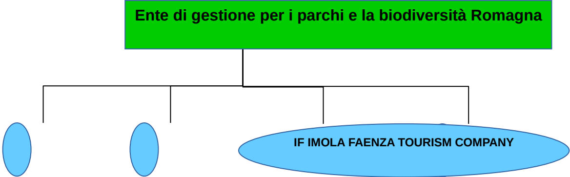
Grafico delle relazioni tra partecipazioni al 31/12/2020